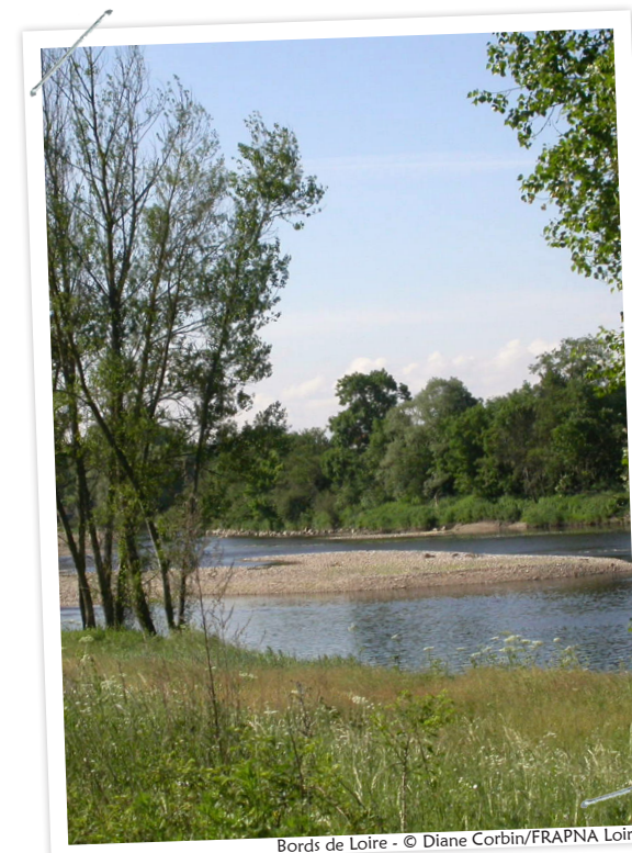
Bords de Loire - © Diane Corbin/FRAPNA Loire

Sentier des bords de Loire Feurs - Ecopôle