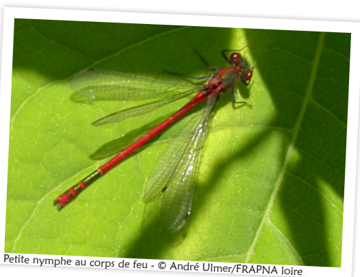
Petite nymphe au corps de feu

Ce sentier vous mène jusqu'à l'Ecopôle du Forez - géré par la FRAPNA Loire - centre d'études, d'observations et de découvertes de la vie sauvage et espace d'animations et d'expositions sur les rives du fleuve.